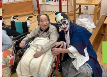
節分の日にパカ殿とハイチーズ！