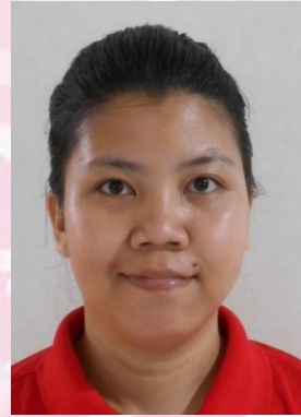
イさん (介護員) ジンさん (介護員)