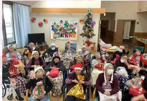
たくさんのプレゼントをありがとう！