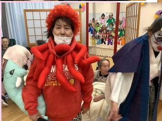
鬼はソト！ 福はウチ！