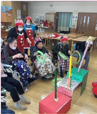
みんなで輪投げゲーム！