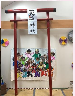
正月飾りで新年をお祝い