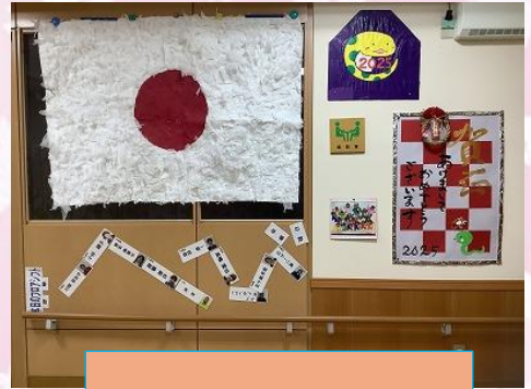
蛇年になりました！