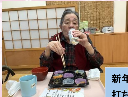
新年を迎えおせち料理に舌鼓を 打ちました！