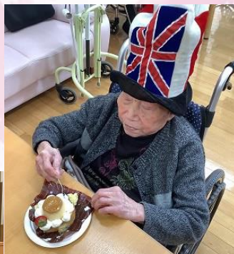
手作りケーキ、おいしいね！