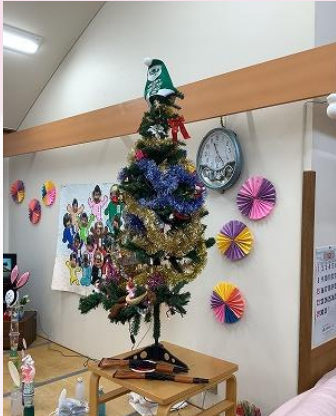
冬はクリスマスやね！