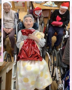
サンタさんから もらっちゃいました！